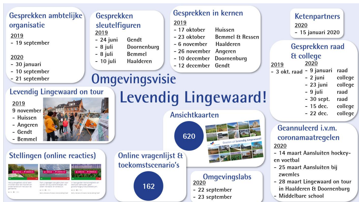
Figuur 2: Overzicht activiteiten gesprek met de samenleving omgevingsvisie Lingewaard.

Op basis van de opbrengsten uit de beleidsanalyse, gesprekken met college- en raad, gesprekken met de medewerkers van de gemeente, gesprekken in de kernen, online vragenlijst, ansichtkaart, gesprekken met de ketenpartners en de omgevingslabs is het koersdocument opgesteld.