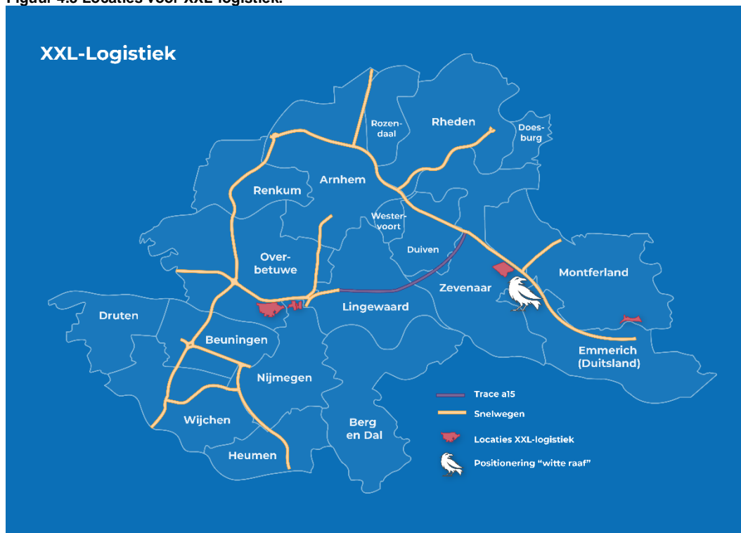
Figuur 4.3 Locaties voor XXL-logistiek.