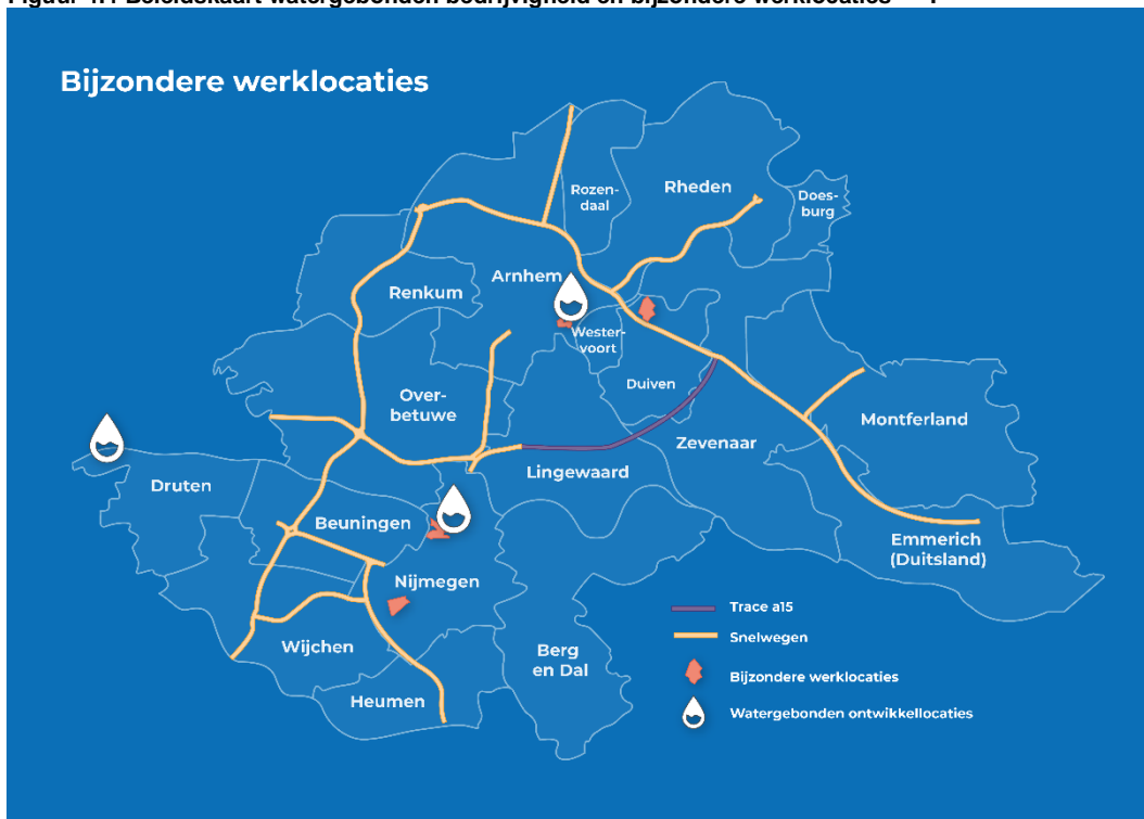
Figuur 4.4 Beleidskaart watergebonden bedrijvigheid en bijzondere werklocaties

Watergebonden bedrijventerreinen zijn van groot belang voor zowel logistiek als industrie in de Provincie Gelderland. In Figuur 4.4 zijn de kansrijke watergebonden ontwikkellocaties en de locatie van de bijzondere werklocaties (zie volgende paragraaf) aangegeven.